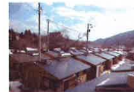
木造戸建仮設住宅（本町団地）

全国初の木造戸建て仮設住宅完成 4月25日 火石団地13戸 5月6日 本町団地17戸 5月23日 中上団地63戸 計93棟に避難者261人が入居