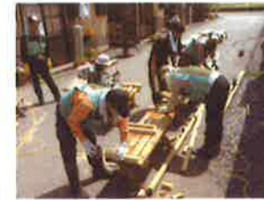
トヨタグループボランティア活動