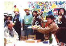
中上団地の住民と支援者の交流会