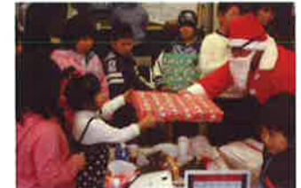
クリスマス会の様子