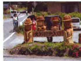
火石団地で看板設置(協力: 仙遊会)