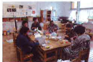
集会所での活動(手芸サークルくろみの会)