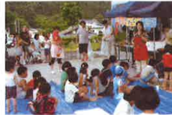
下有住地区の夕涼み会