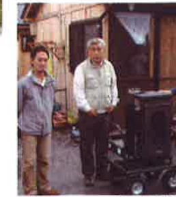
more trees によるプレットストープ提供