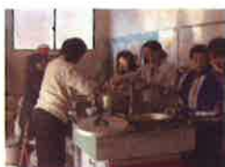
職員と婦人消防協力隊の炊出し