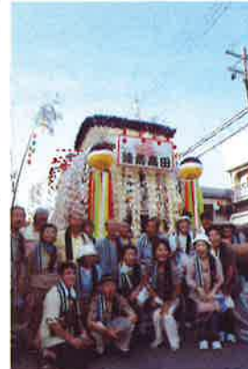
動く七夕の山車おひるめ (住田町夏まつりにて)