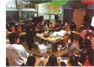
ひうちなだ 燄難防災会のうどん炊出しと交流会