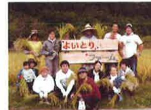
体験農園よいとりファーム