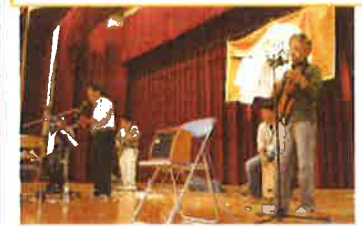
バンド「ザ・シモアリス」の演奏