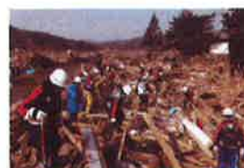
消防団員による行方不明者捜索

大槌町への派遣 4月2日～7月28日 窓口業務等 (各4日間、全12回、延べ48名)