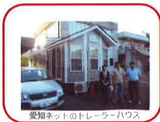
愛知ネットのトレーラーハウス